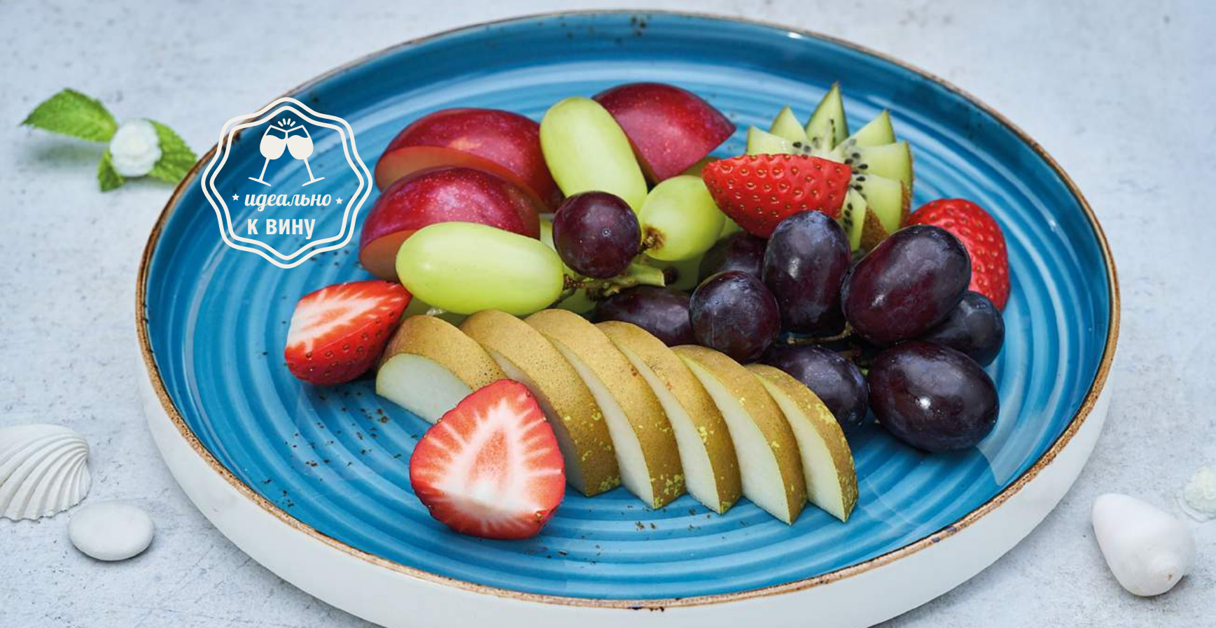
Фруктовая тарелка по сезону