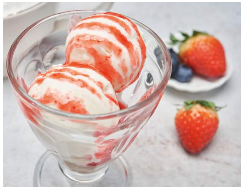
Мороженое с топингом