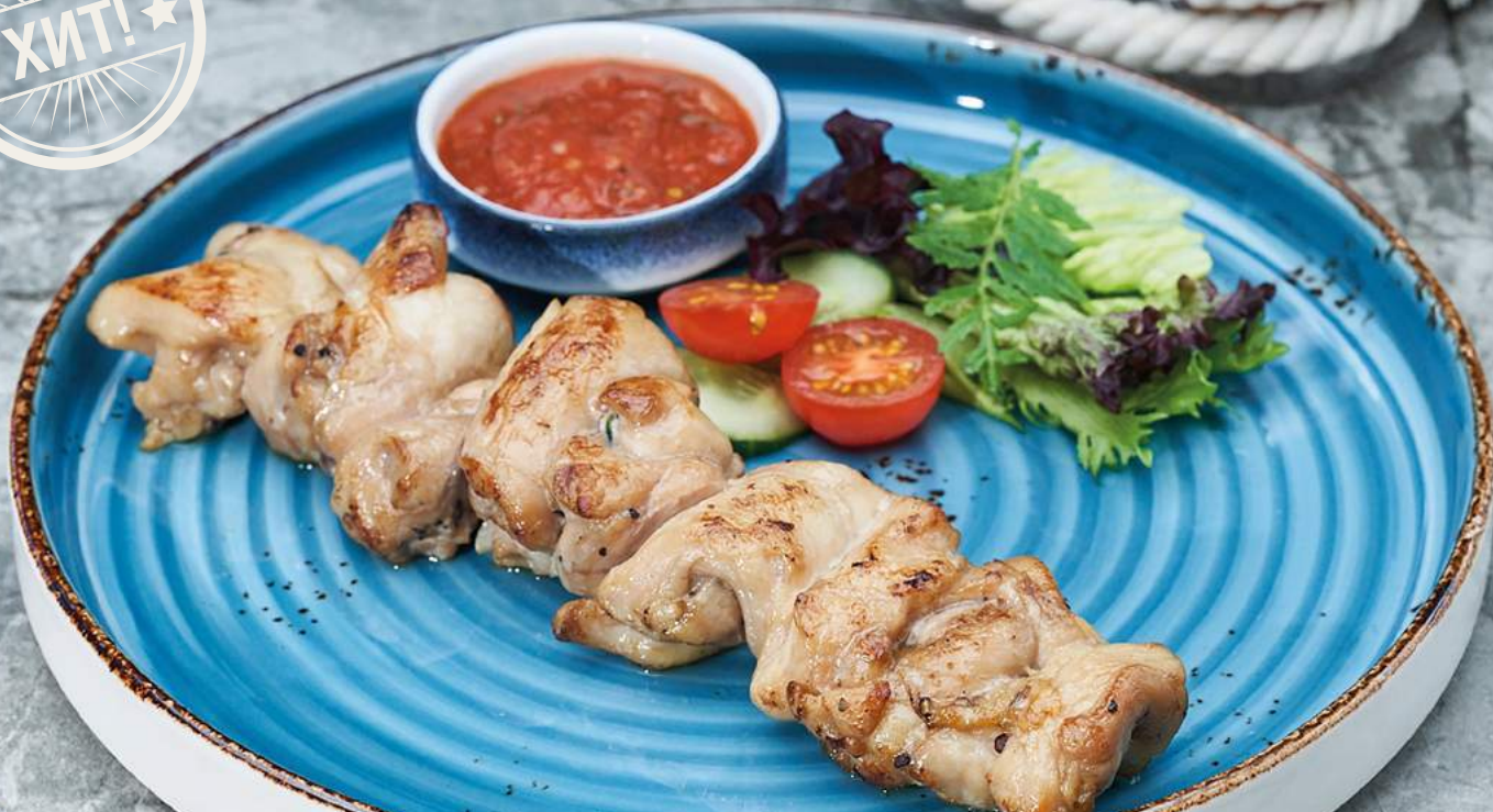
Куриный шашлык со свежими овощами и соусом сацебели